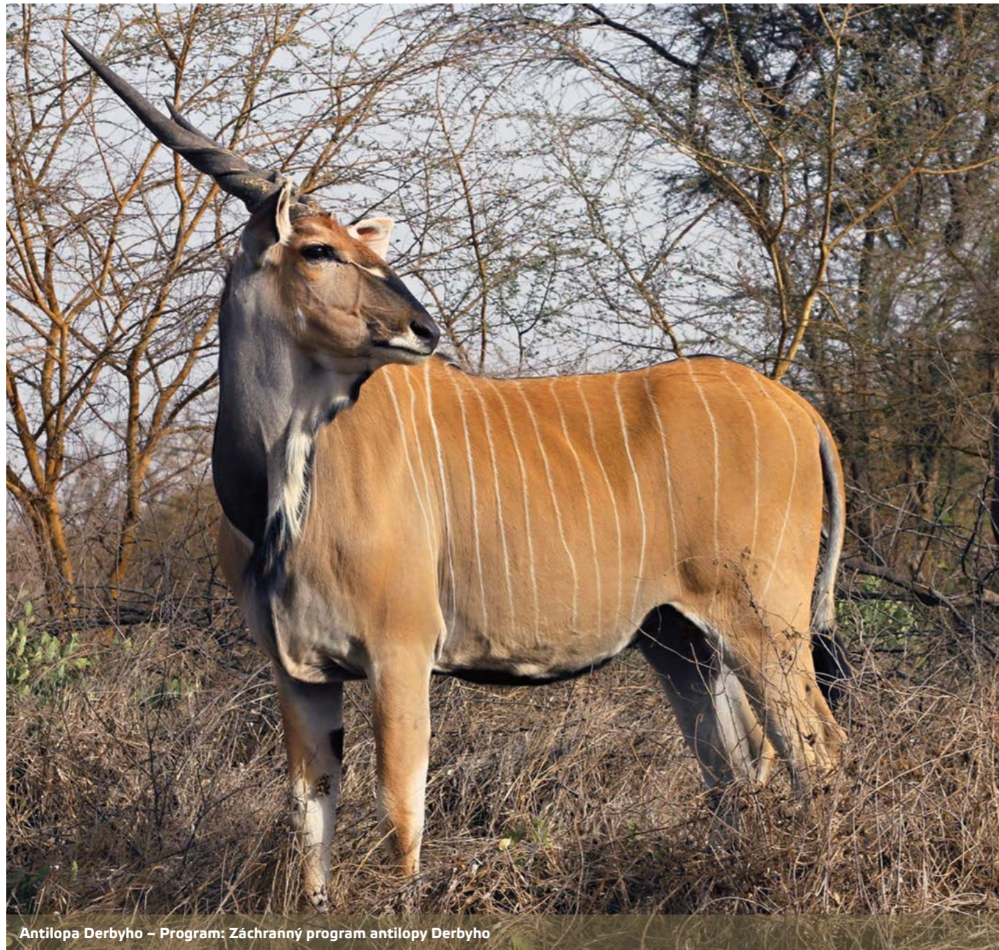
Antilopa Derbyho – Program: Záchraný program antilopy Derbyho