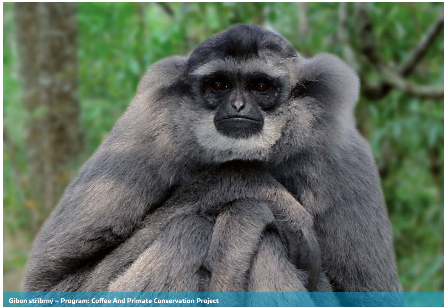
Gibon stříbrný – Program: Coffee And Primate Conservation Project