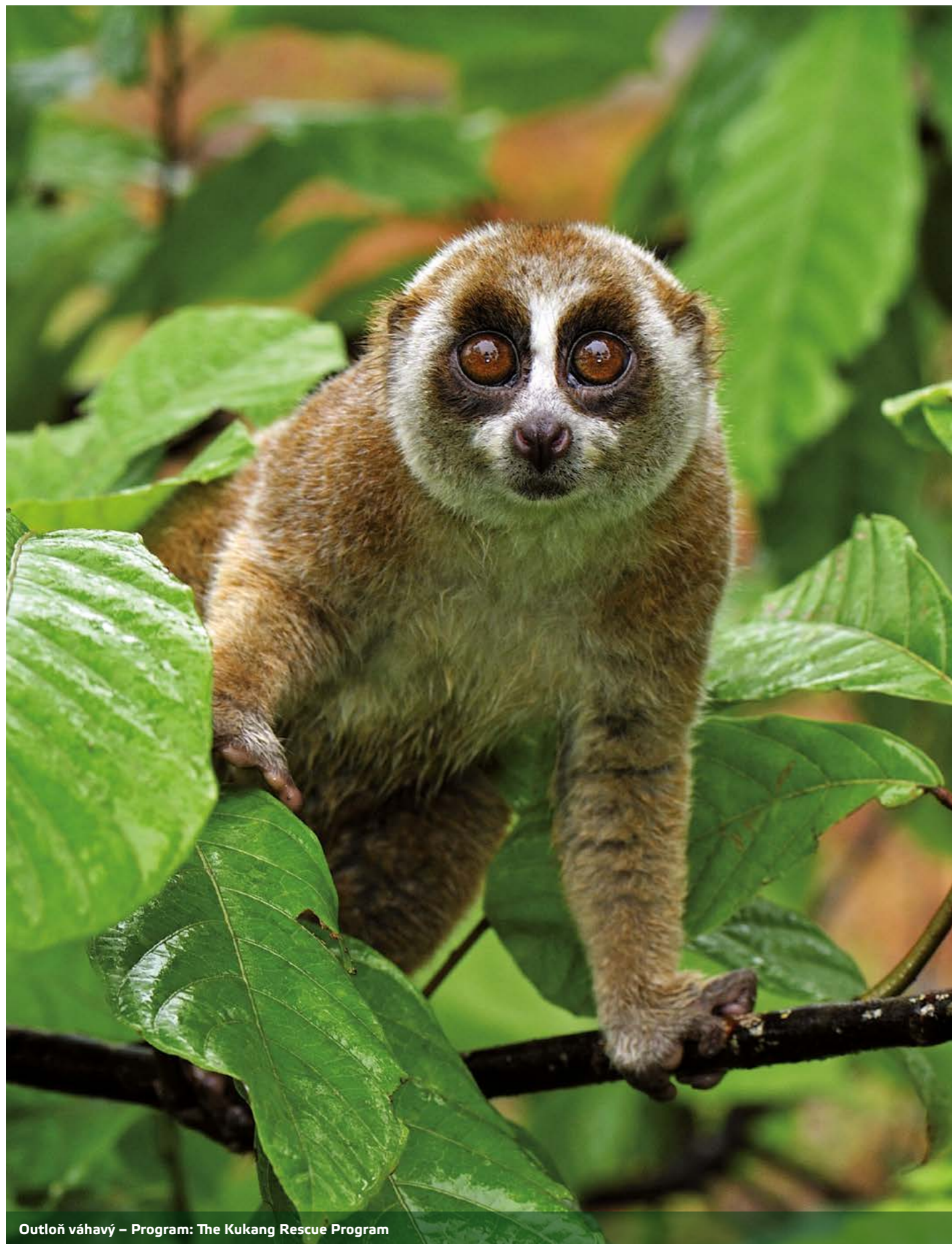
Outloň váhavý – Program: The Kukang Rescue Program